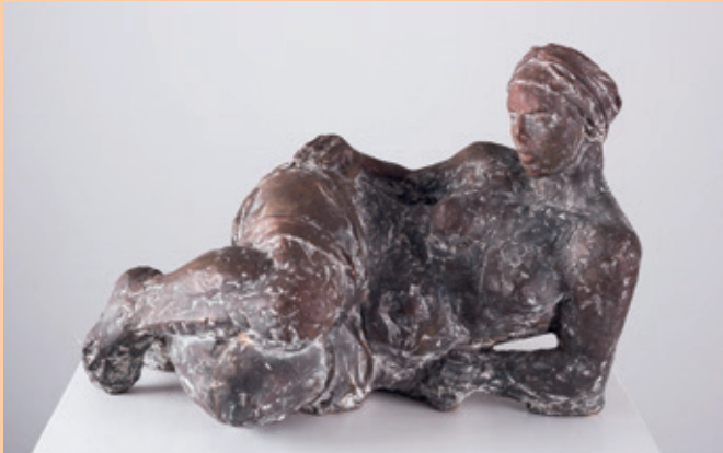
Wanda Pratschke, Klassische, Bronze, 2003