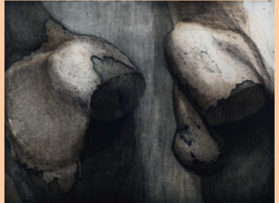
Irmgard Fleming, 2 Torsi, Radierung, 1988

Die kommende Jahresausstellung 2022: „Erzähl!“