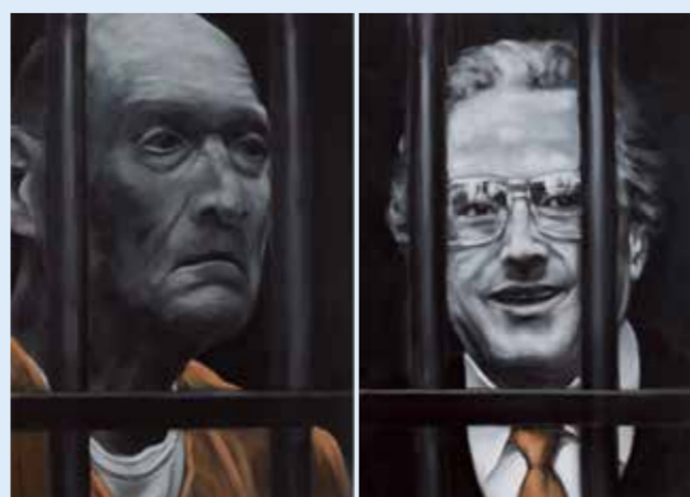
Gerhard Silber, Macht 3, Acryl auf Leinwand, 2021

Informationen, auch zur Geschichte der Sammlung und zu Publikationen www.mtk.org/kunstsammlung