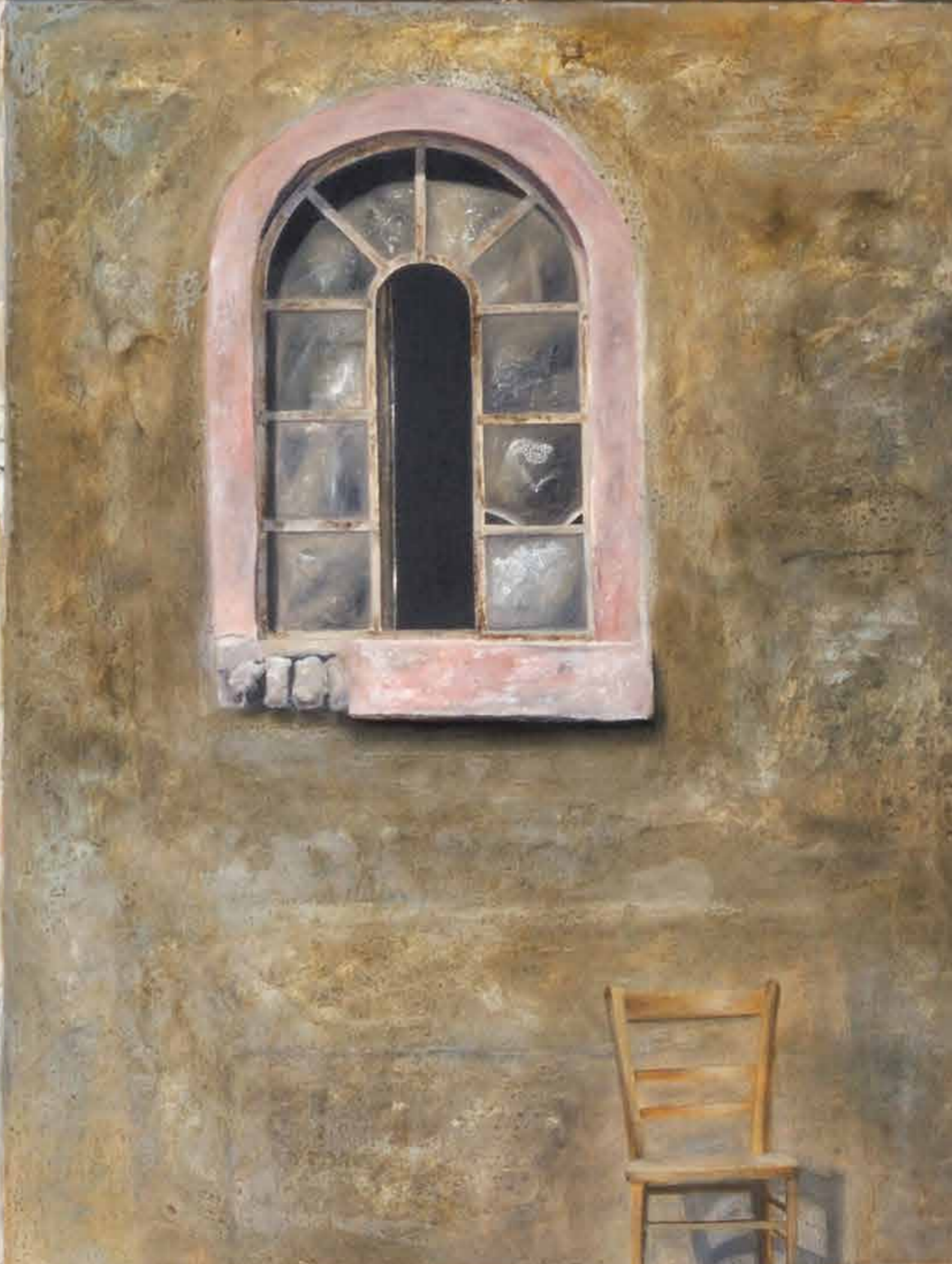
Anno Jung, Rettershof, Acryl/Öl auf Leinwand, 1996 | Grafik: Sandra Lamm, lammdesign.de