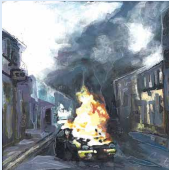
Marten Großfeld, another burning car, Mixed media, 2021

Das Geheimnis der Kunst entfaltet sich in der Betrachtung. Die Aufforderung an das Werk, seine Geschichte preiszugeben, ist ebenso unumgänglich, wie aus dem eigenen (Er-)Leben heraus einen Erzählfaden zu spinnen. Fragen, Antworten ... Von Buchstaben und Buchskulpturen, Malerei, Installation und Fotografie bis zum Bildband: zeichenhaft und spielerisch eröffnen sich individuelle Erzählwelten.